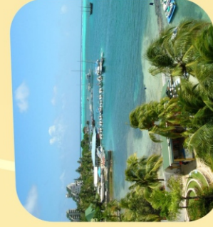
San Andrés Islas