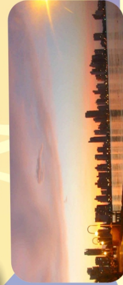
Cartagena de Indias