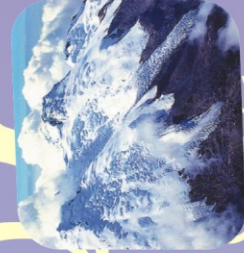
Nevado de Ruiz