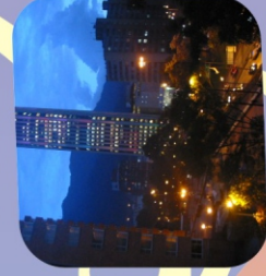
Santa Fé de Bogotá